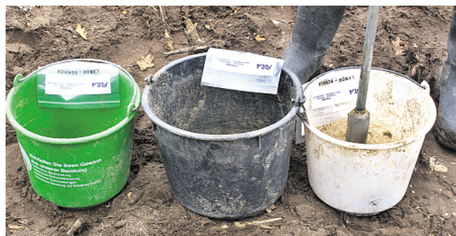
Wer den Bodenstickstoff bestimmen will, der muss ihn messen. Ein Abschätzen ist nicht gut möglich und führt zu Fehldüngung.

Mais und Rüben erhalten die N-Düngung in der Regel in einer Gabe zur Saat. Die Mineralisation des Bodenstickstoffs (Freisetzung mine-