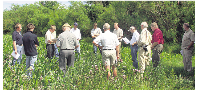
Im Rahmen von Feldbegehungen werden Ergebnisse und Erfahrungen aus der Beratung in die Praxis getragen.

von Grünlandumbrüchen. Um die gewonnenen Erkenntnisse auch über die Beratungsgebiete hinaus anderen Landwirten zugänglich zu machen, erhalten alle Beratungsträger die Möglichkeit, zu speziellen Themenbereichen aus den Beratungsgebieten zu berichten. So wurde in der Januar Ausgabe über den Einsatz von Stickstoffstabilisatoren und im April über die Maisengsaat berichtet. In der heutigen Ausgabe werden Erfahrungen mit der Methode der Spät-Frühjahrs- N_{min} -Werte dargestellt. Constanze Harms, MLUR